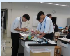
小松工業高校 インターンシップ