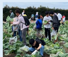
石川県立大学農場見学 & 野菜収穫ツアー