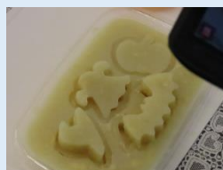
ハロウィン いもようかんを作ろう