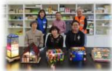
第5期生ステンド金曜クラス