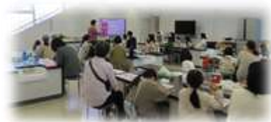
レインボーフラワーをつくろう