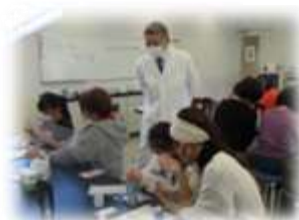
はじめての化粧品づくり体験