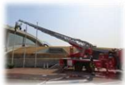
ヒルズ防災体験教室より